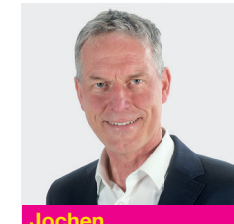
Jochen Haußmann MdL

Politische Interessen: Bildungspolitik, Digitalisierung